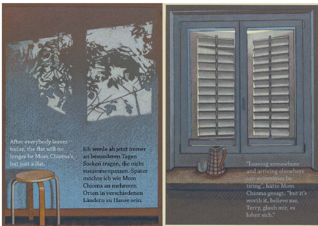
Um zeichnen zu können brauche es viel Übung und Disziplin.