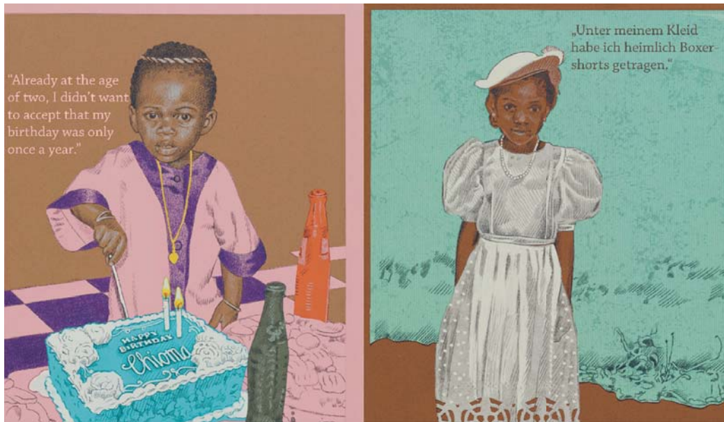
Um stereotype Figuren zu vermeiden, arbeitete Christine Aebi mit Fotos.

alleine ist. Das wirkt ermutigend.» Mit Illustrationen könnten sich ihre Schülerinnen und Schüler dennoch gewinnen lassen. Sich Zeit zu nehmen und in sich selbst Hineinzuhören sei für einige von ihnen ungewohnt. Umso mehr freut sich ihre Lehrerin, wenn die Illustrationen richtig tiefgründig, vielschichtig und persönlich geworden sind und die verschiedensten Facetten der Erzählerin oder des Erzählers zum Ausdruck kommen.